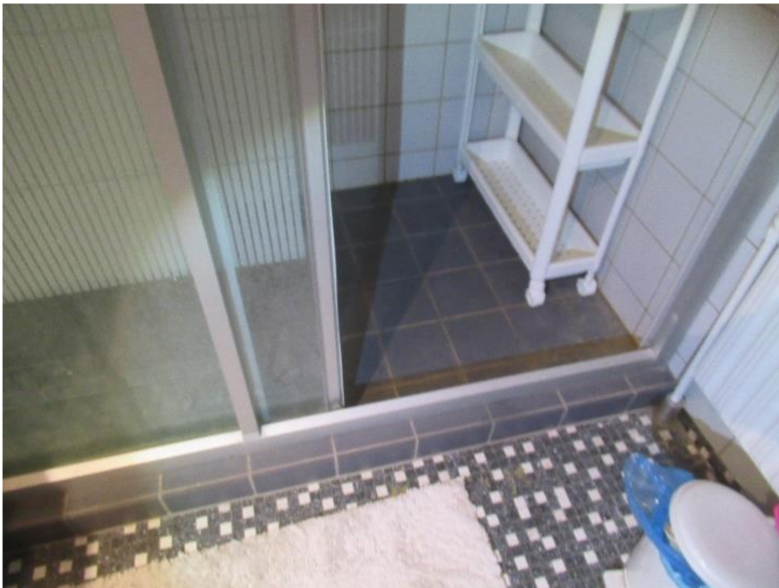
Eksempel på partielt renoveret badeværelse.