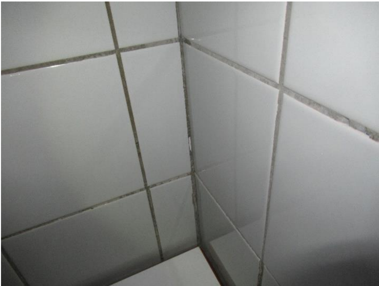
Eksempel på manglende / porøse flisefuger.