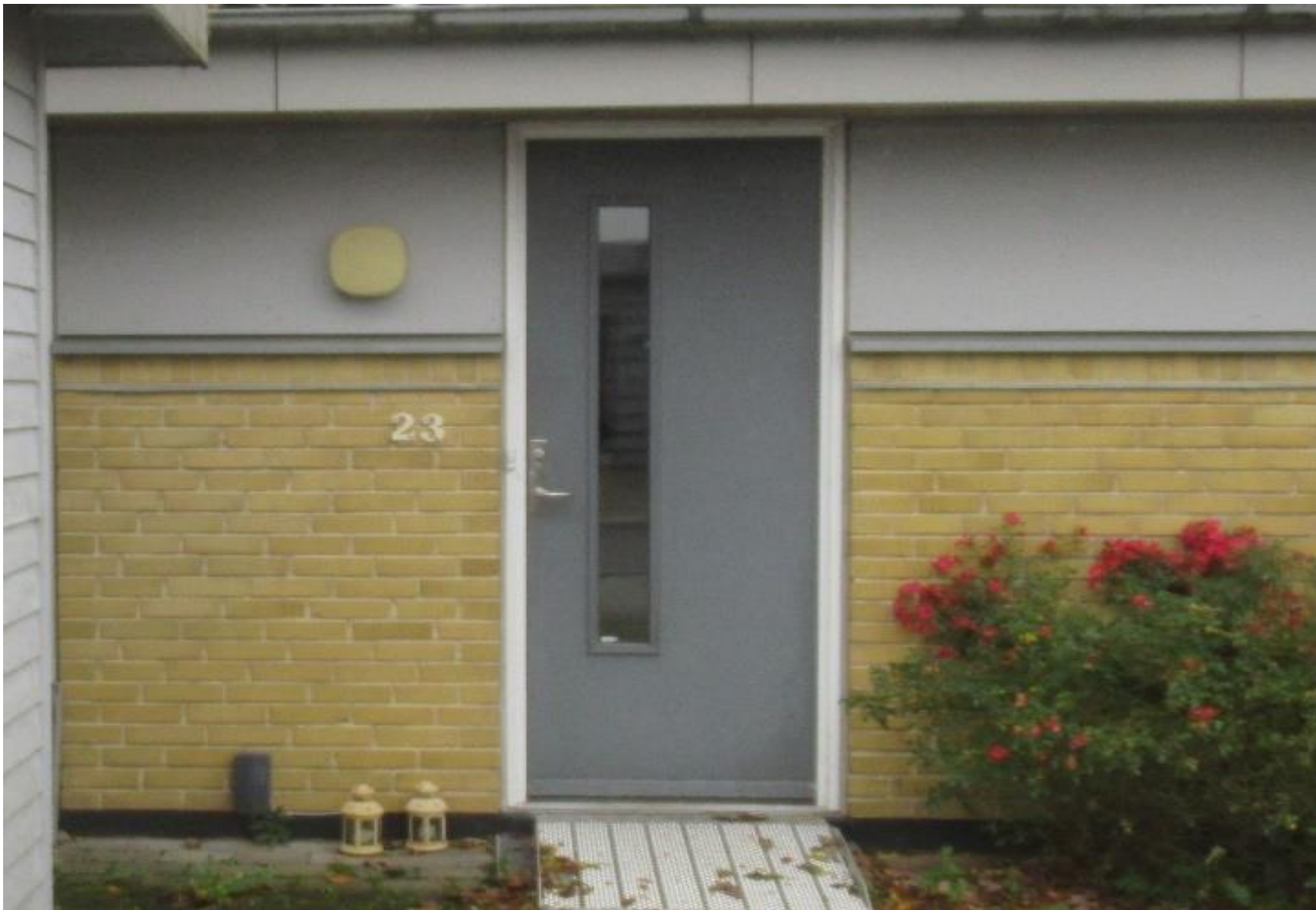
Entredøre af træ – formodentlig årgang 1989 – dermed 32 år gl.