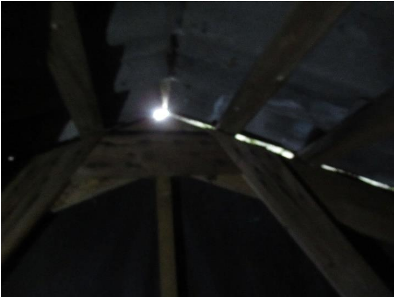
Eksempel på utætheder i overgang mellem gavlbeklædning og tagplader.