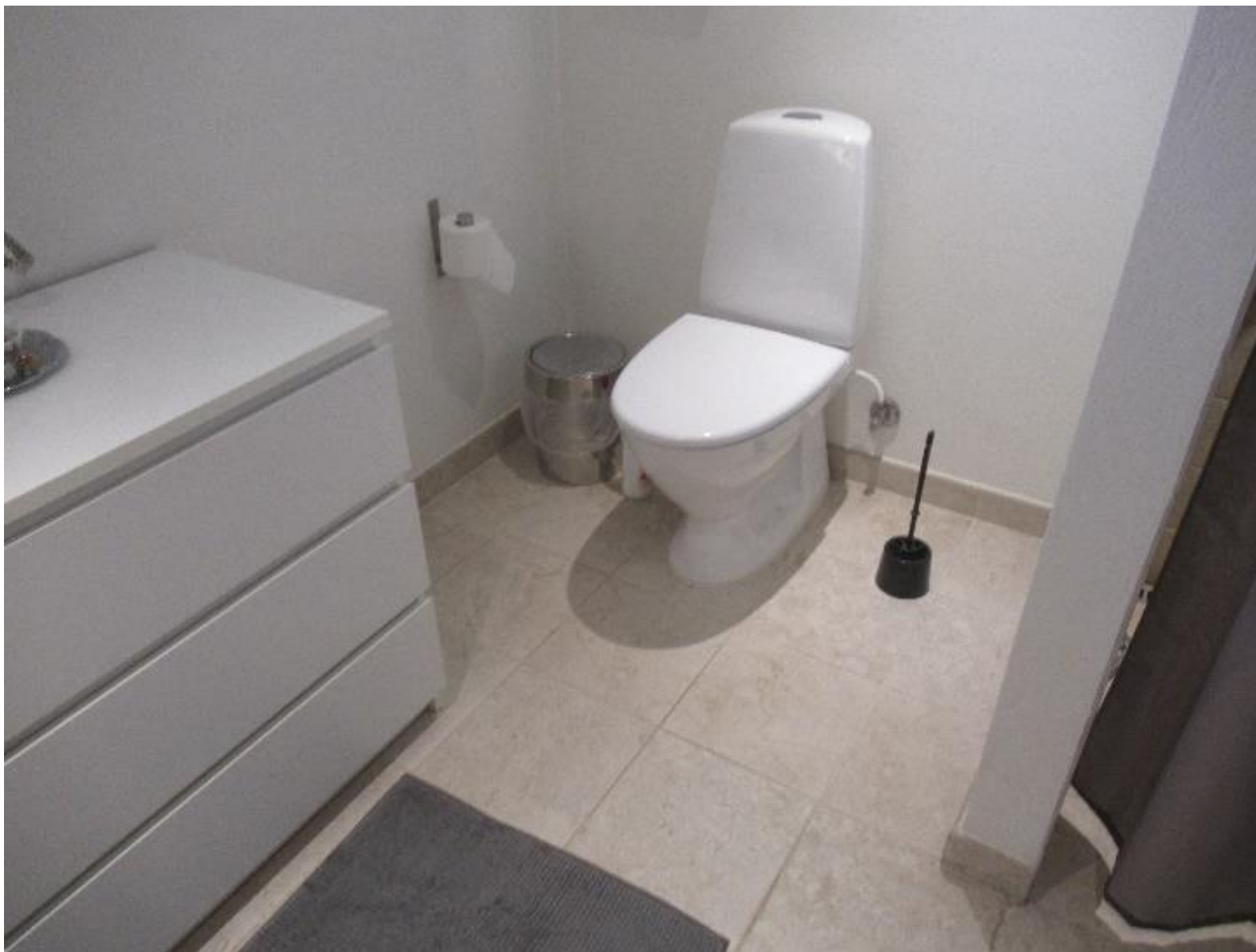
Eksempel på renoveret / sammenlagt toilet og badeværelse