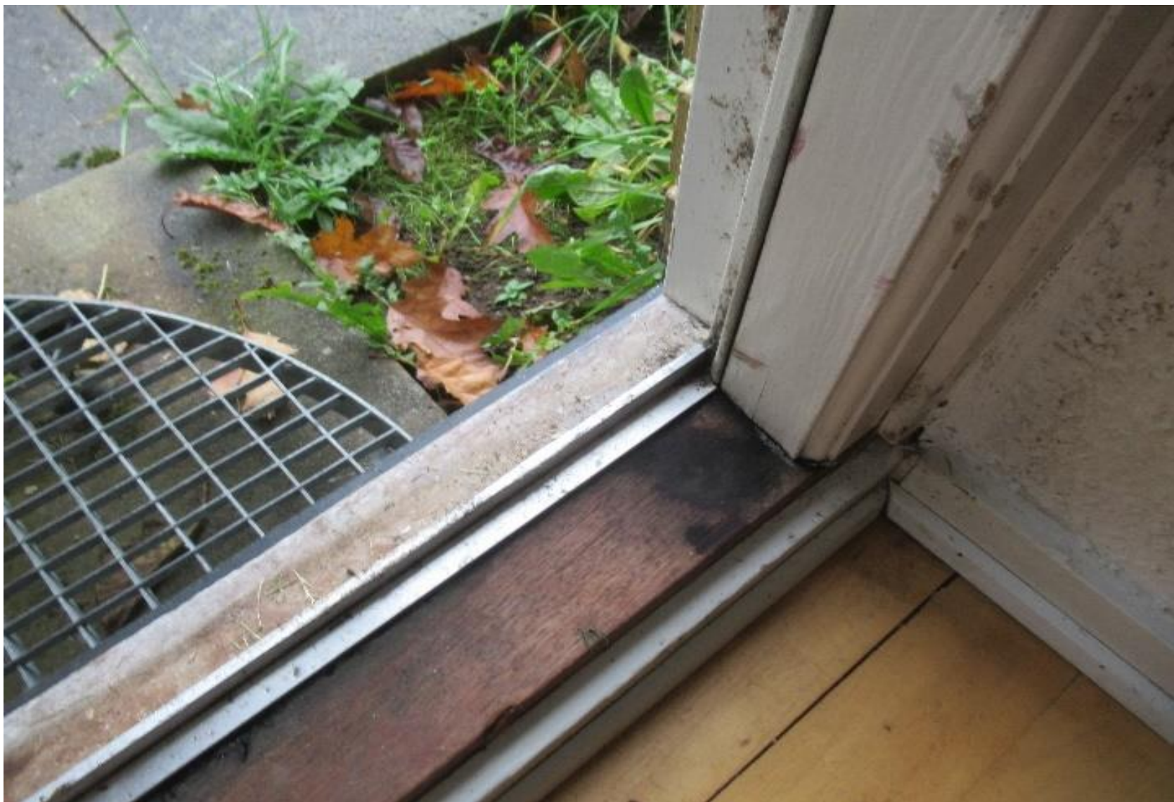
Eksempel på dørtrin.