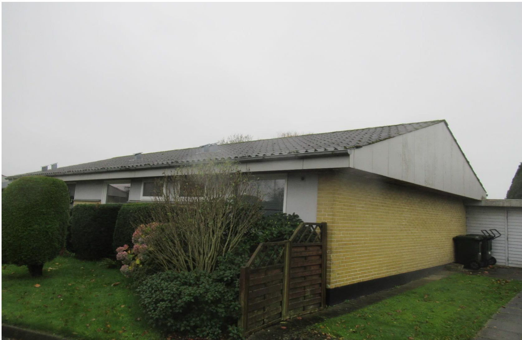
Afd. 401 – Vestparken 6-27, opført 1969, 17 boliger - fritliggende og rækkehusbebyggelse.