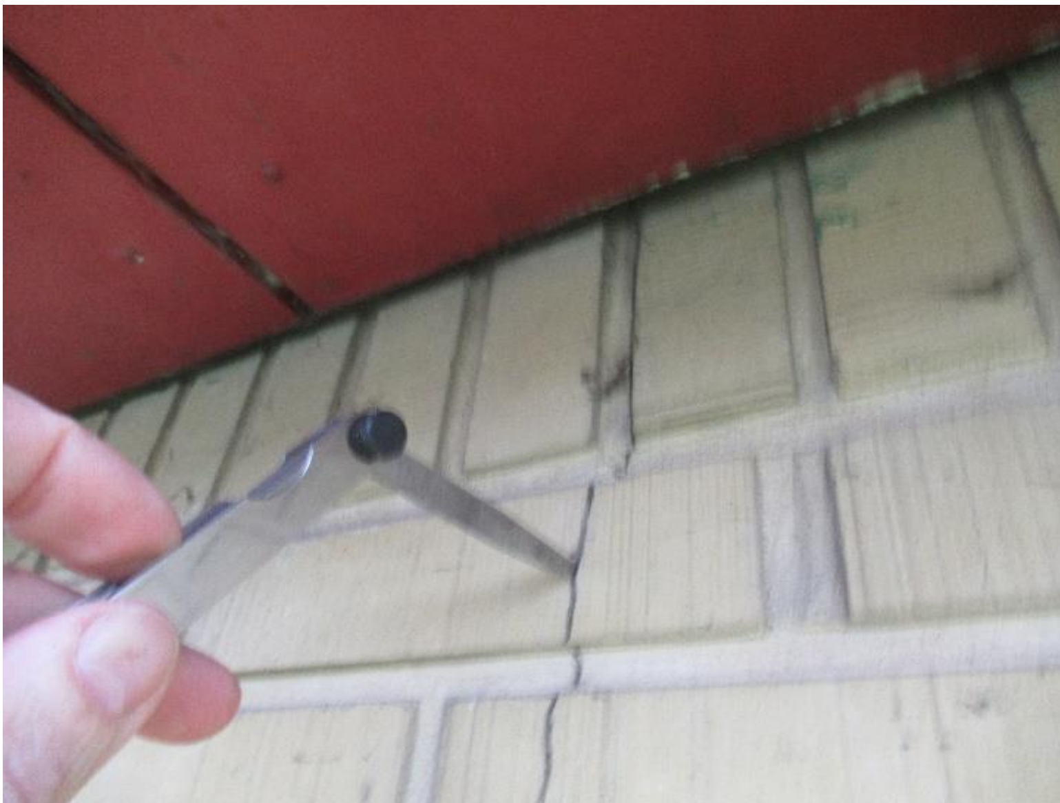
Eksempel på revnedannelse i facade.