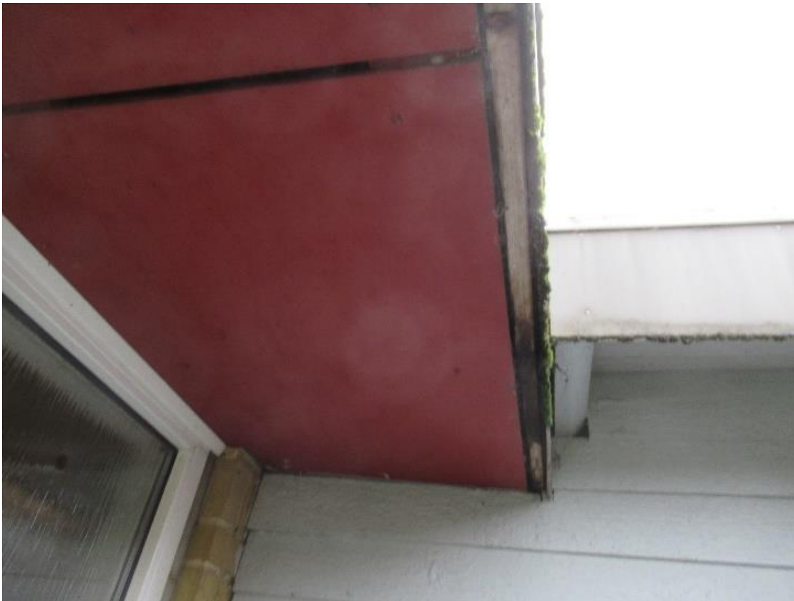
Eksempel på opfugtning af stern.