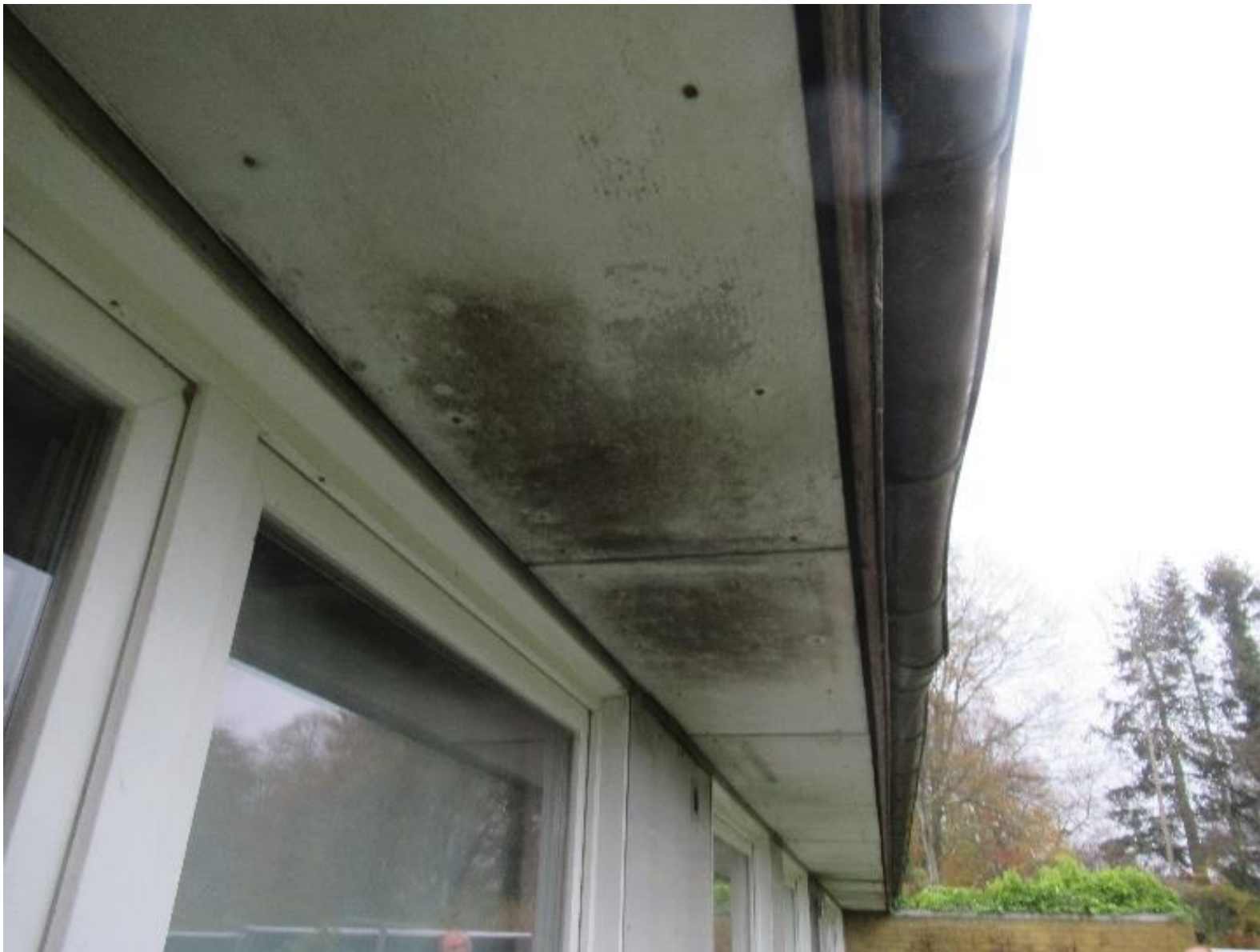
Eksempel på fugtplamager på underbeklædning og beskadiget tagrende.