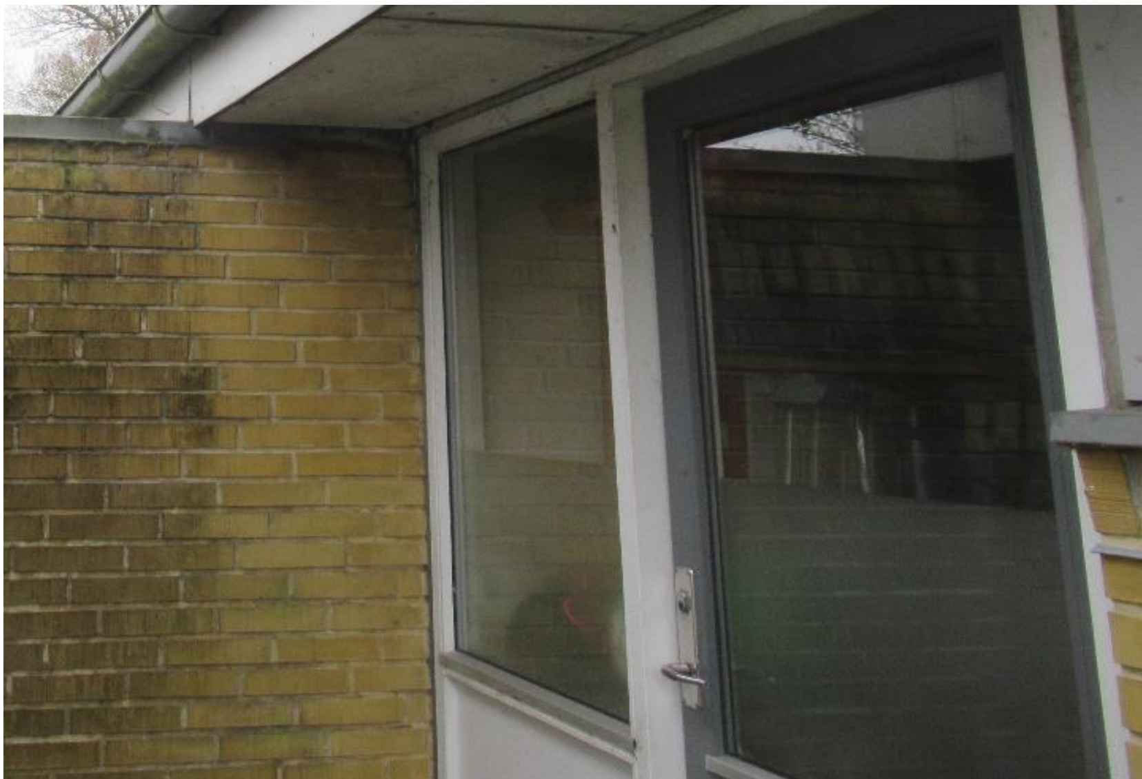
Eksempel på dør- vinduesparti mod haveside.