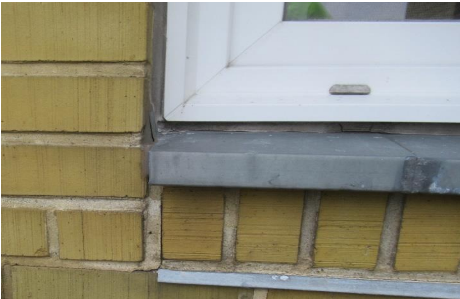
Eksempel på korrosion af zinkinds kud.