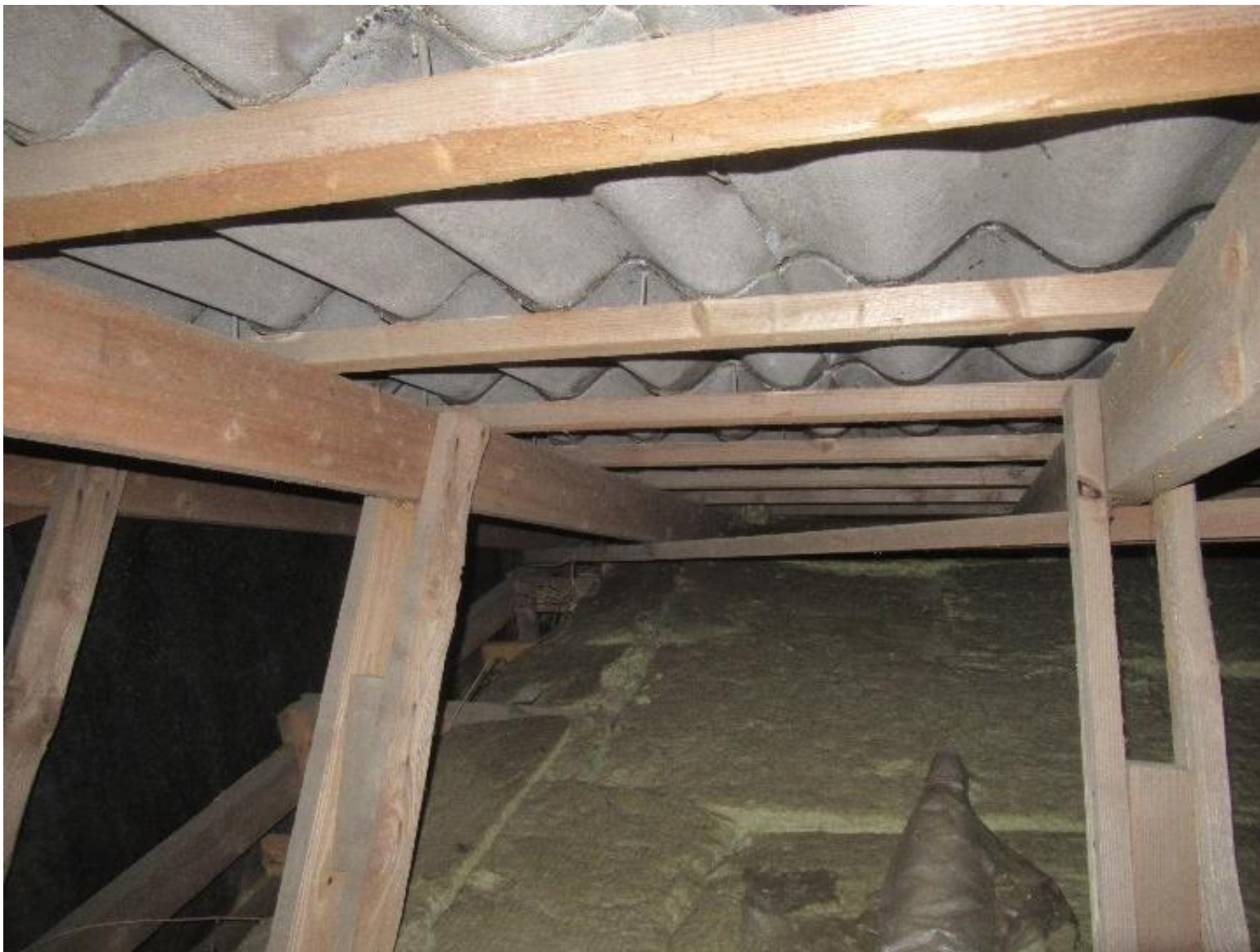
Eksempel på utætheder i samlinger – nr. 16