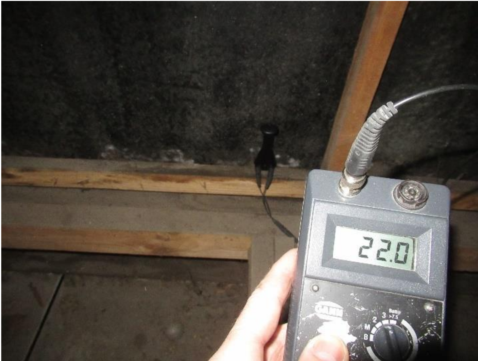
Eksempel på opfugtning af træskelet ved gavlbeklædning.