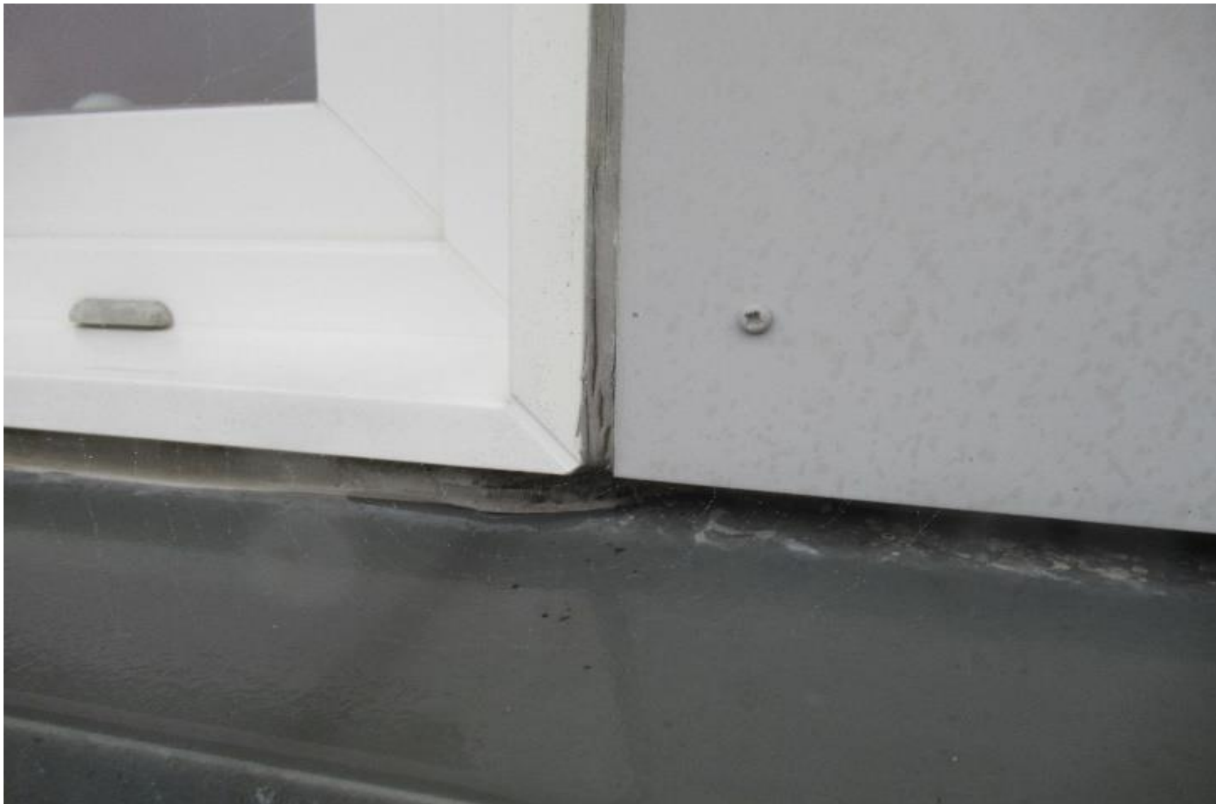
Eksempel på fugeslip.