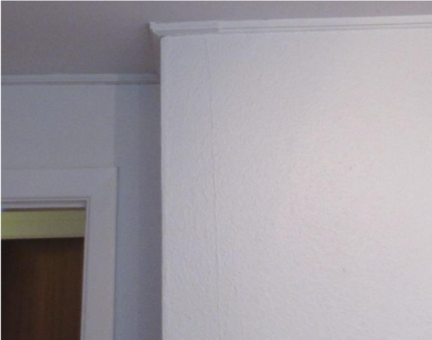
Eksempel på revnedannelse i elementsamling.