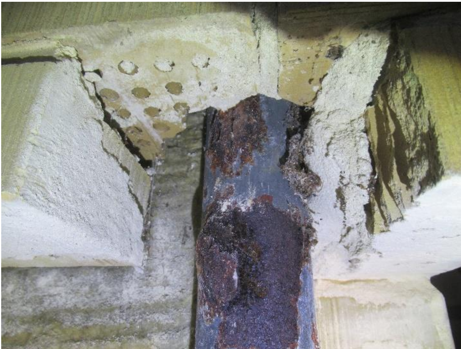
Nærbillede af korroderet bærende stålsøjle.