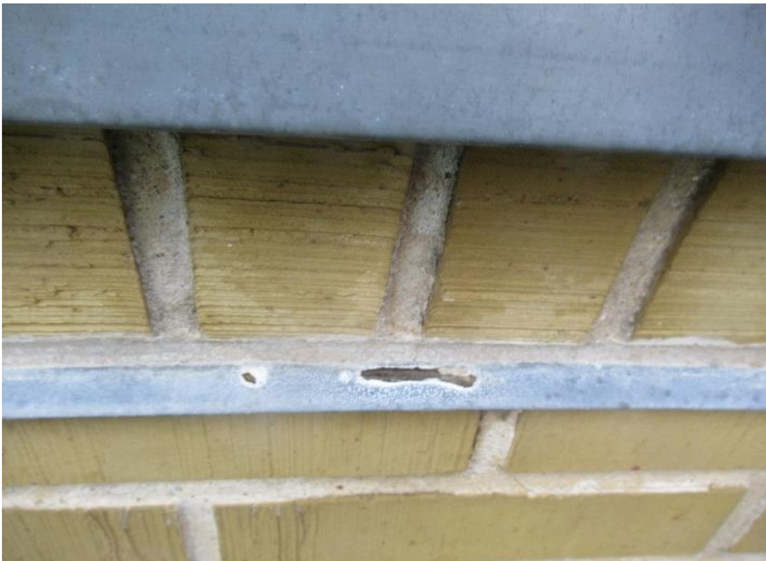
Eksempel på korroderet indskud under sålbænk.