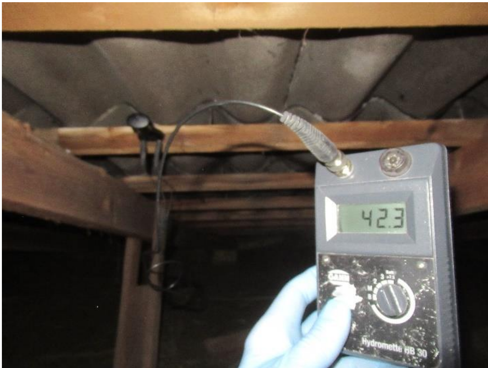
Eksempel meget høj træfugt i lægter.