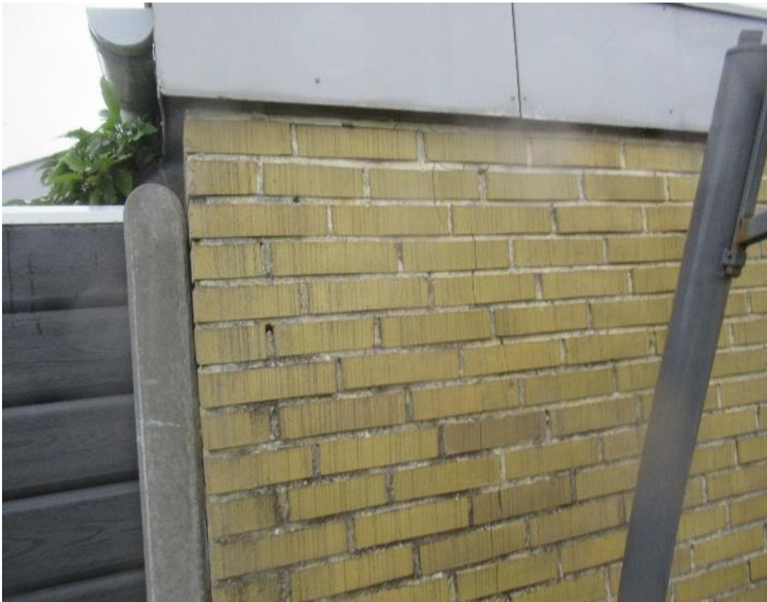
Eksempel på murværksfuger under nedbrydning.