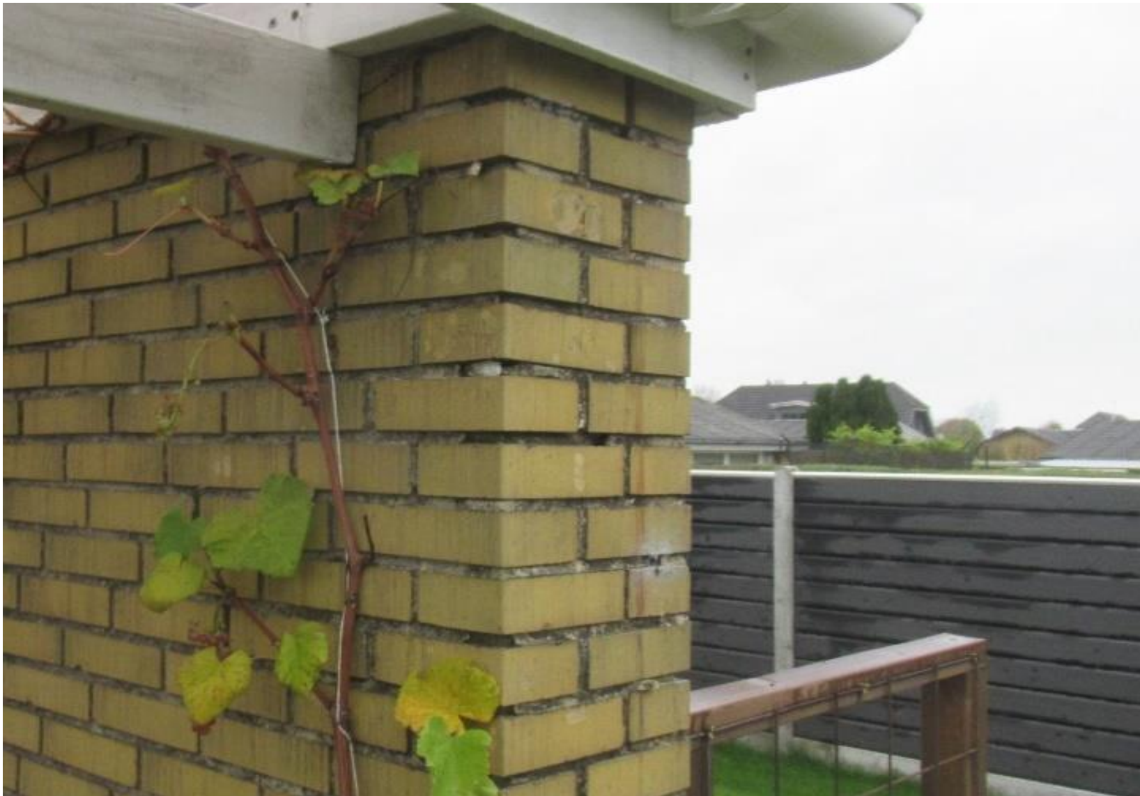
Eksempel på nedbrydning af fuger i murværket.