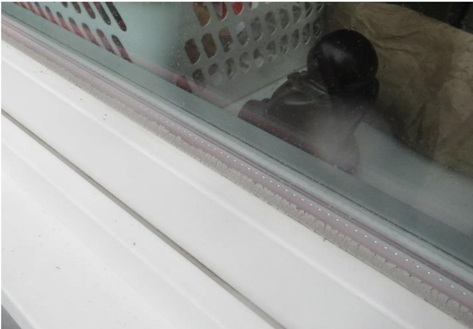
PVC- vinduer årgang 1995, dermed 26 år gl. Smuldrende tætningslister.