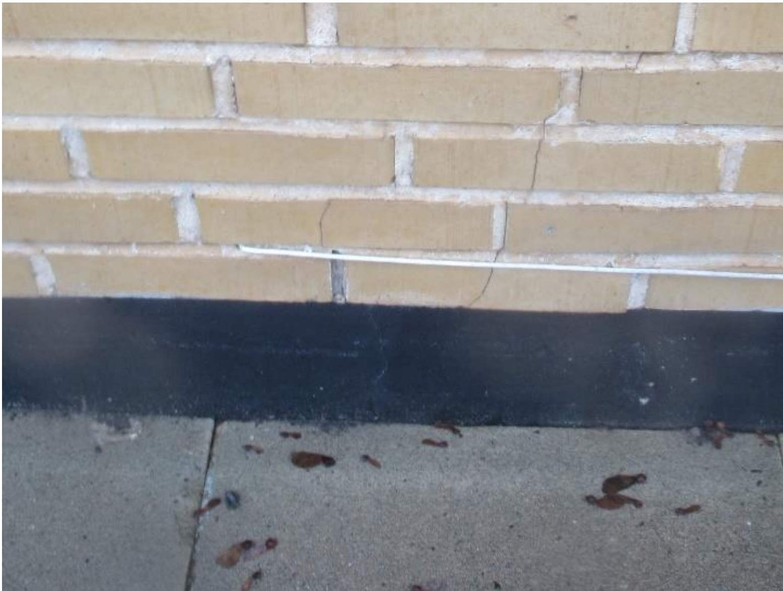
Eksempel på revnedannelse i facader / sokler.