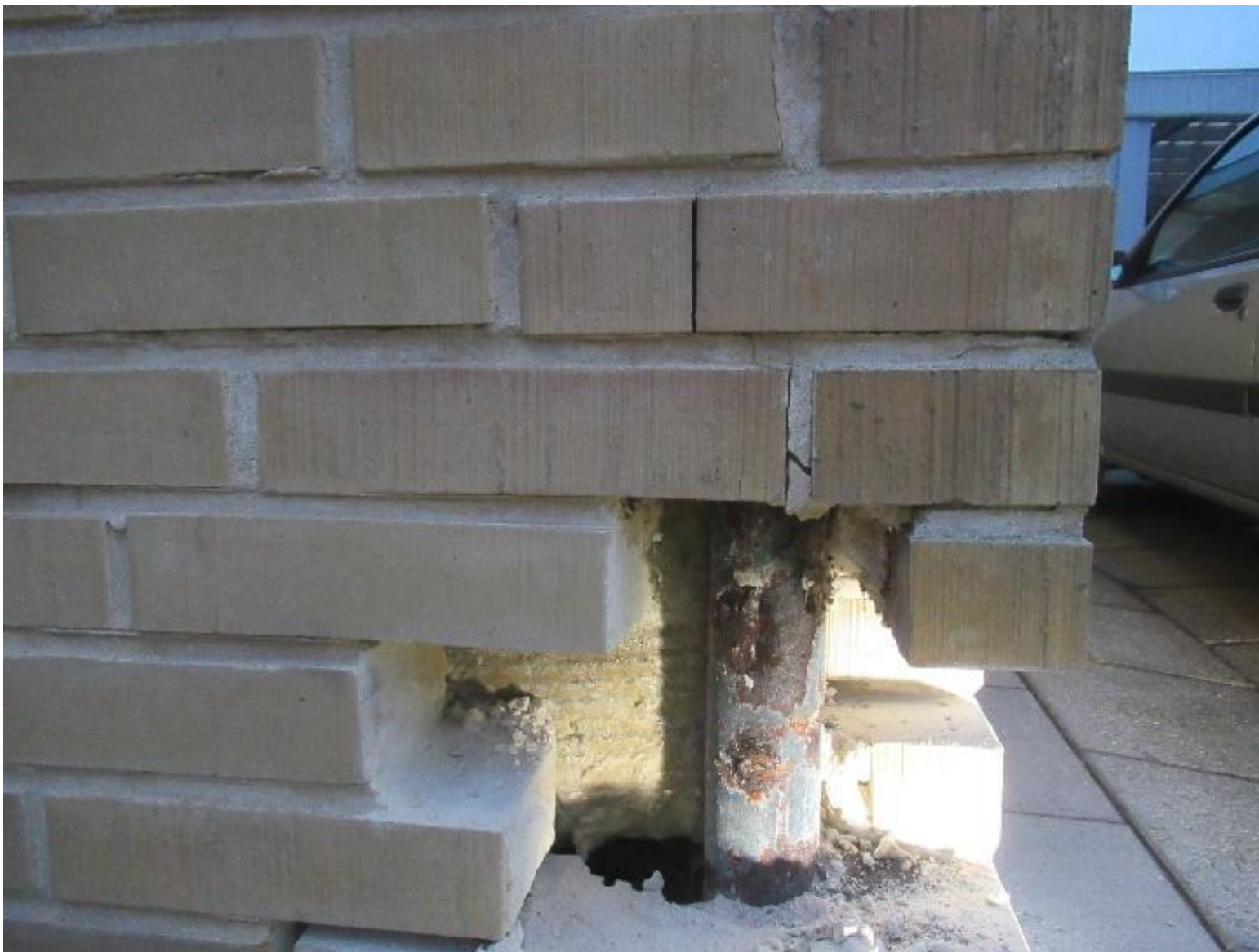
Eksempel på korrosion af bærende stålsøjler.