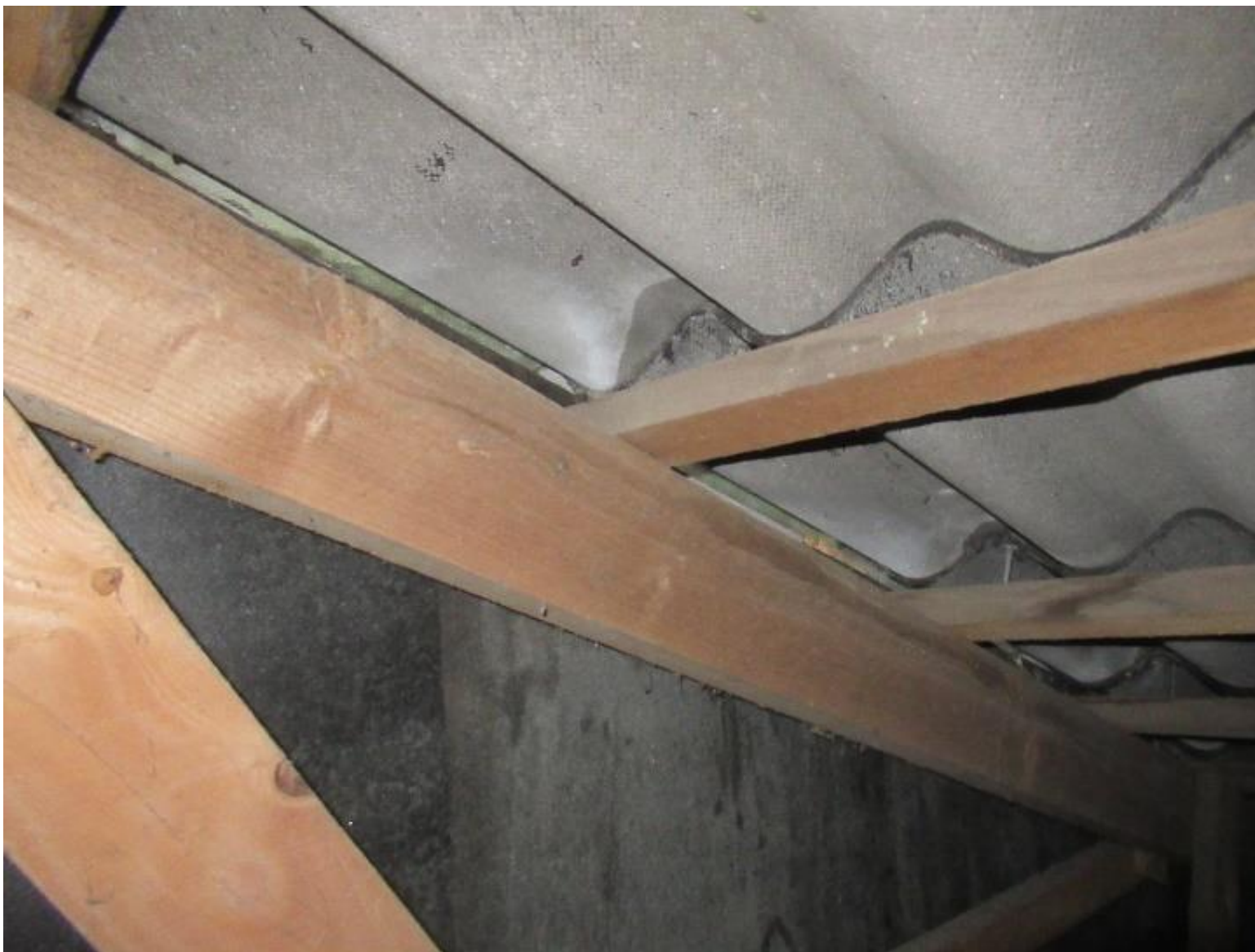
Bølgeplader med asbest – 52 år gl. – Eksempel på utætheder i samlinger – nr. 14