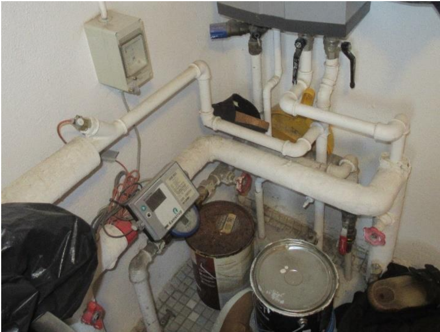
Eksempel på varmeanlæg.