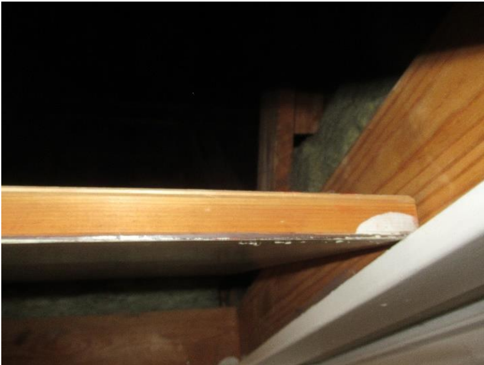
Eksempel på loftslem uden isolering.