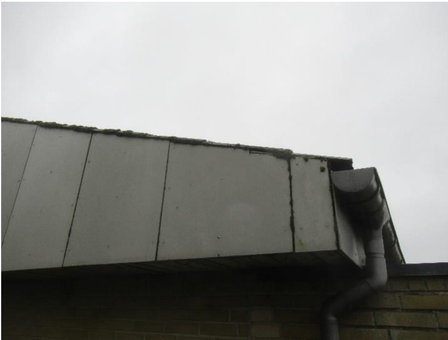
Eksempel på overgang mellem tagplader og gavlbeklædning.