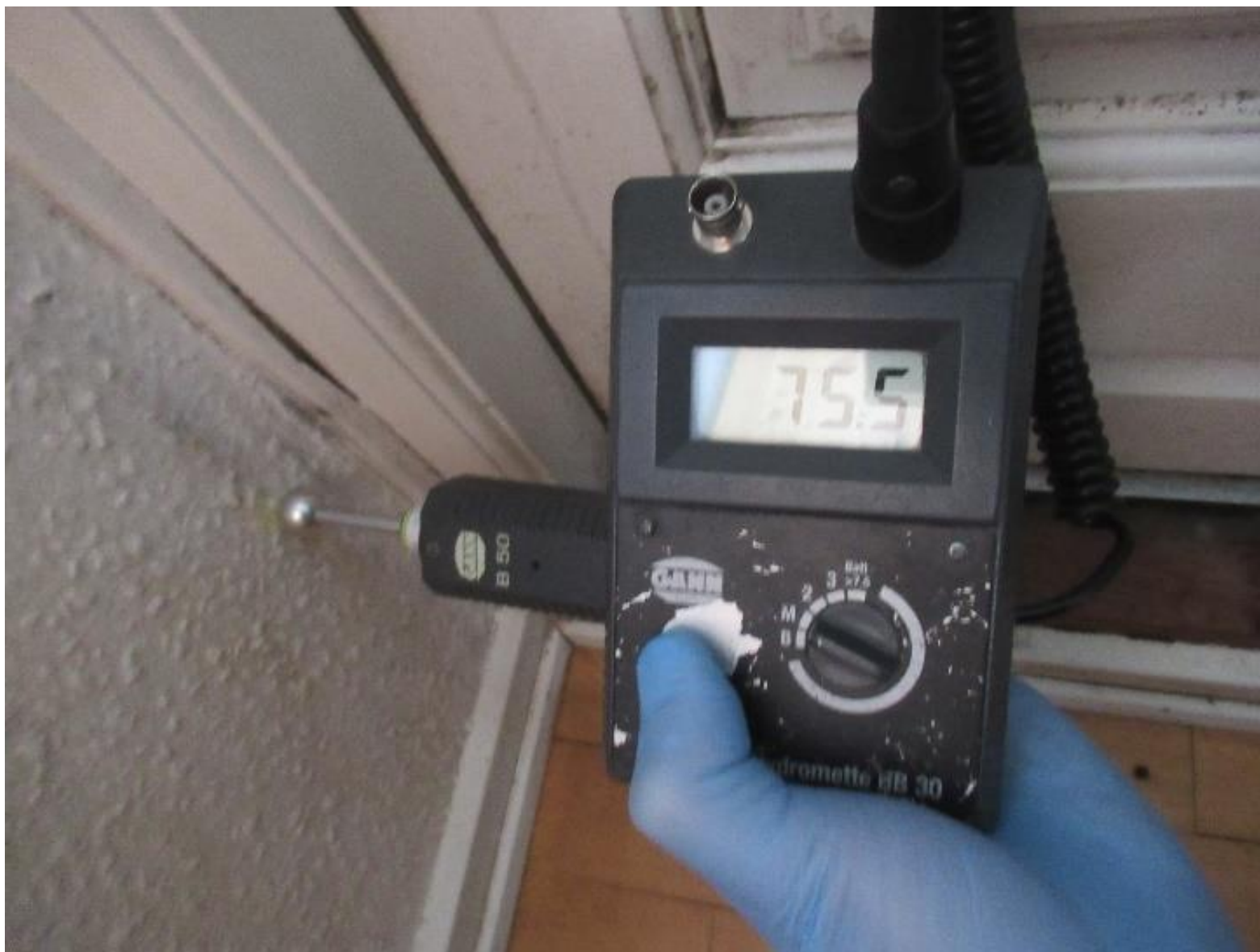
Eksempel på indvendig opfugtning grundet massiv kuldebro bag stålsøjle.