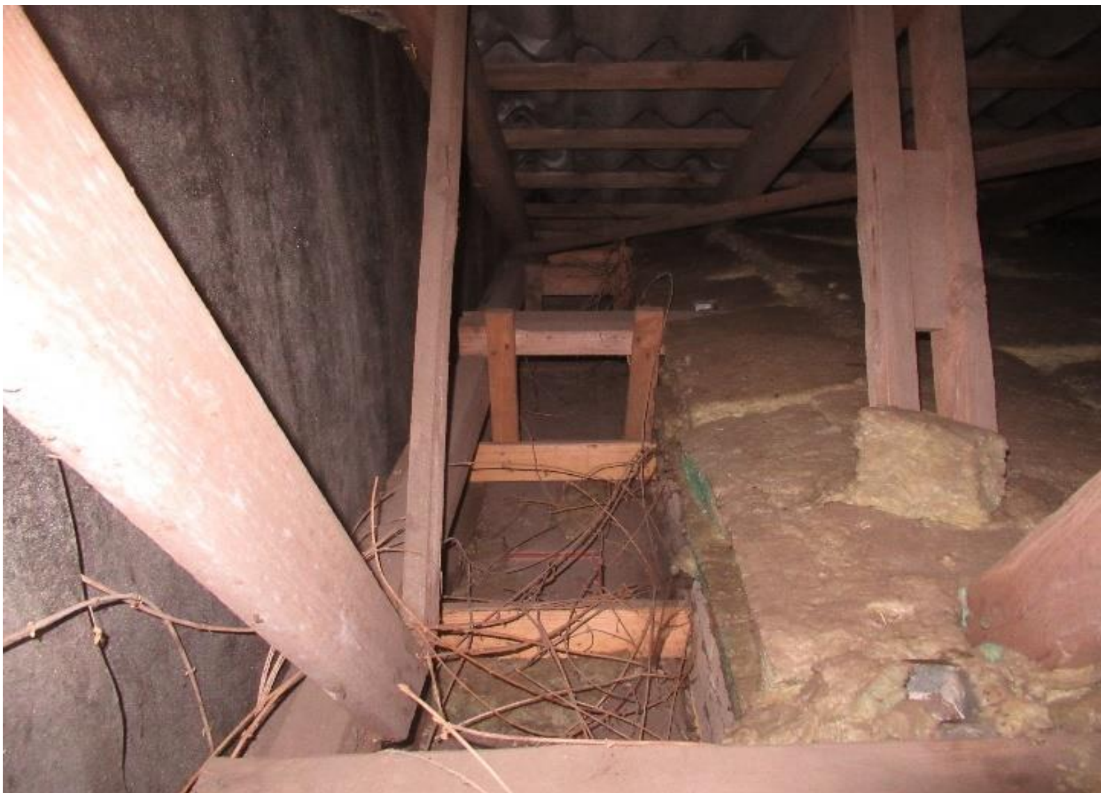
Eksempel på manglende vindstandsning ved gavle.