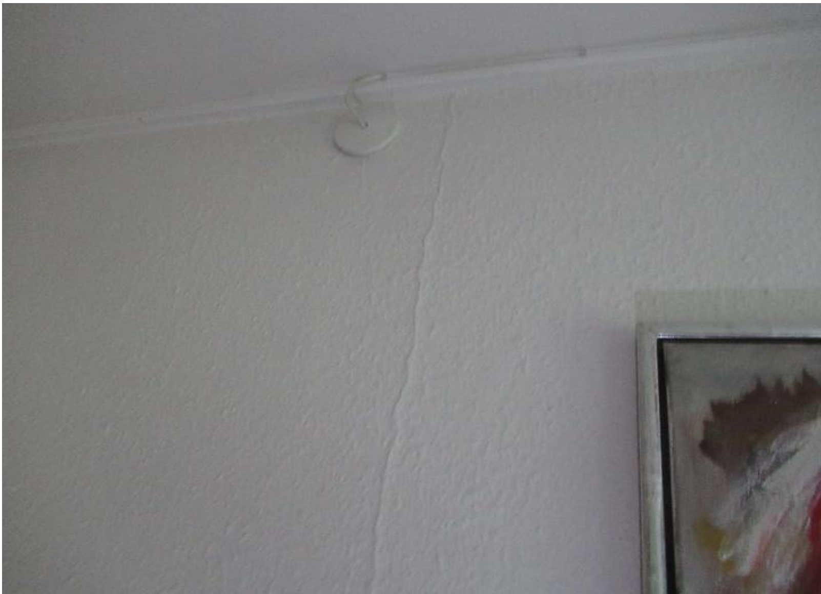
Eksempel på skillevægge med revnedannelse.