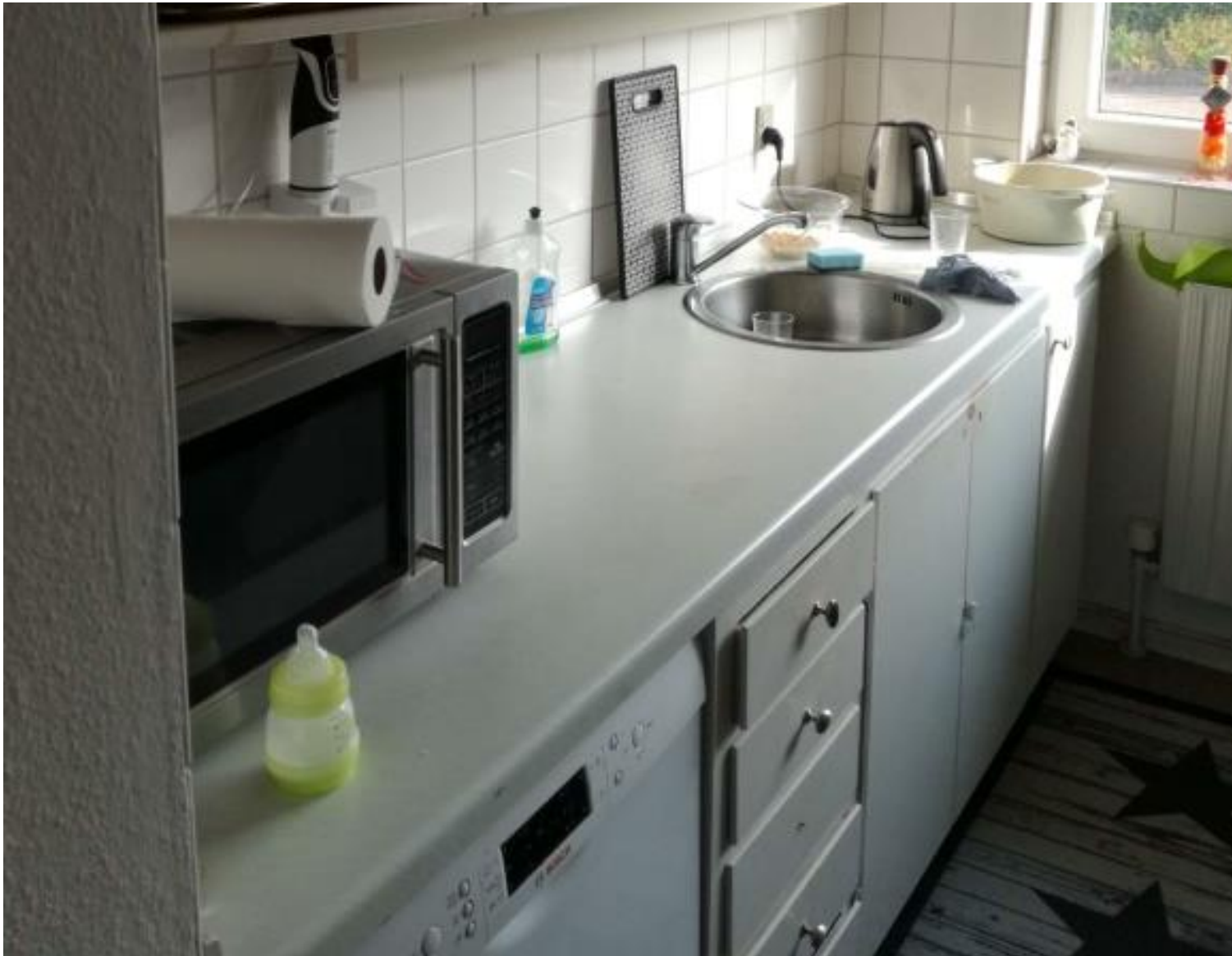
Eksempel på oprindeligt køkken med nyere bordplade.