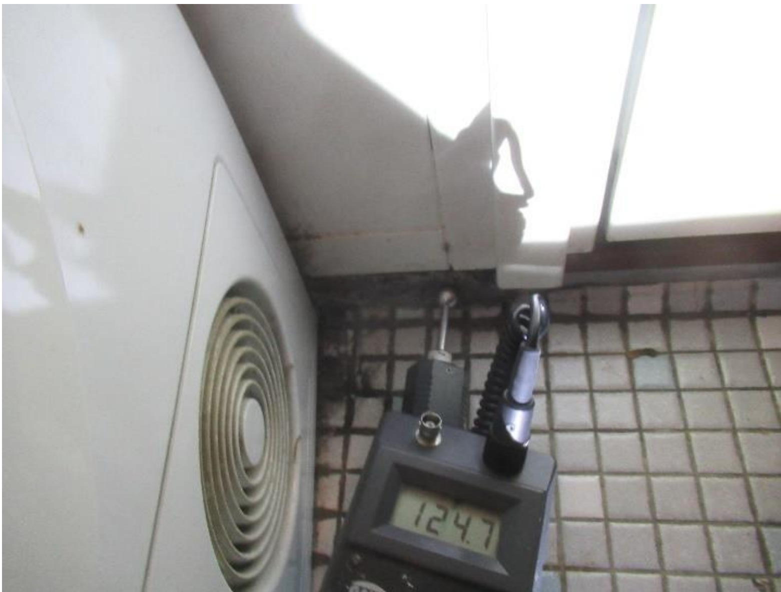
Eksempel på opfugtning grundet kuldebro.