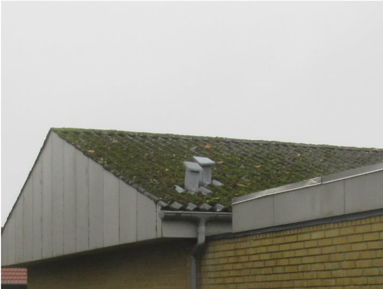
Eksempel på mosbegroning på tagflade.