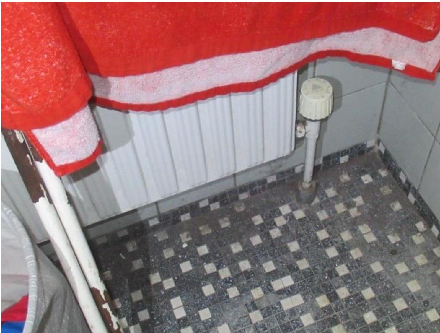
Eksempel på varmeanlæg.