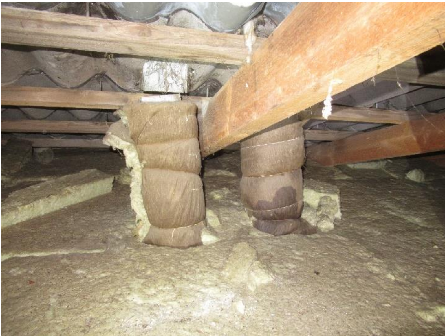
Eksempel på utæt aftrækskanal og manglende kondensisolering.