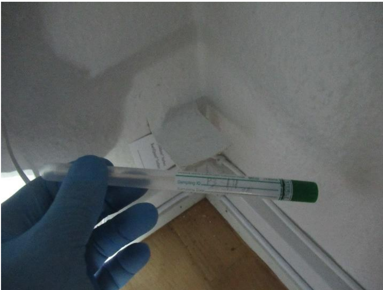
Eksempel på skimmelprøve – kategori B.