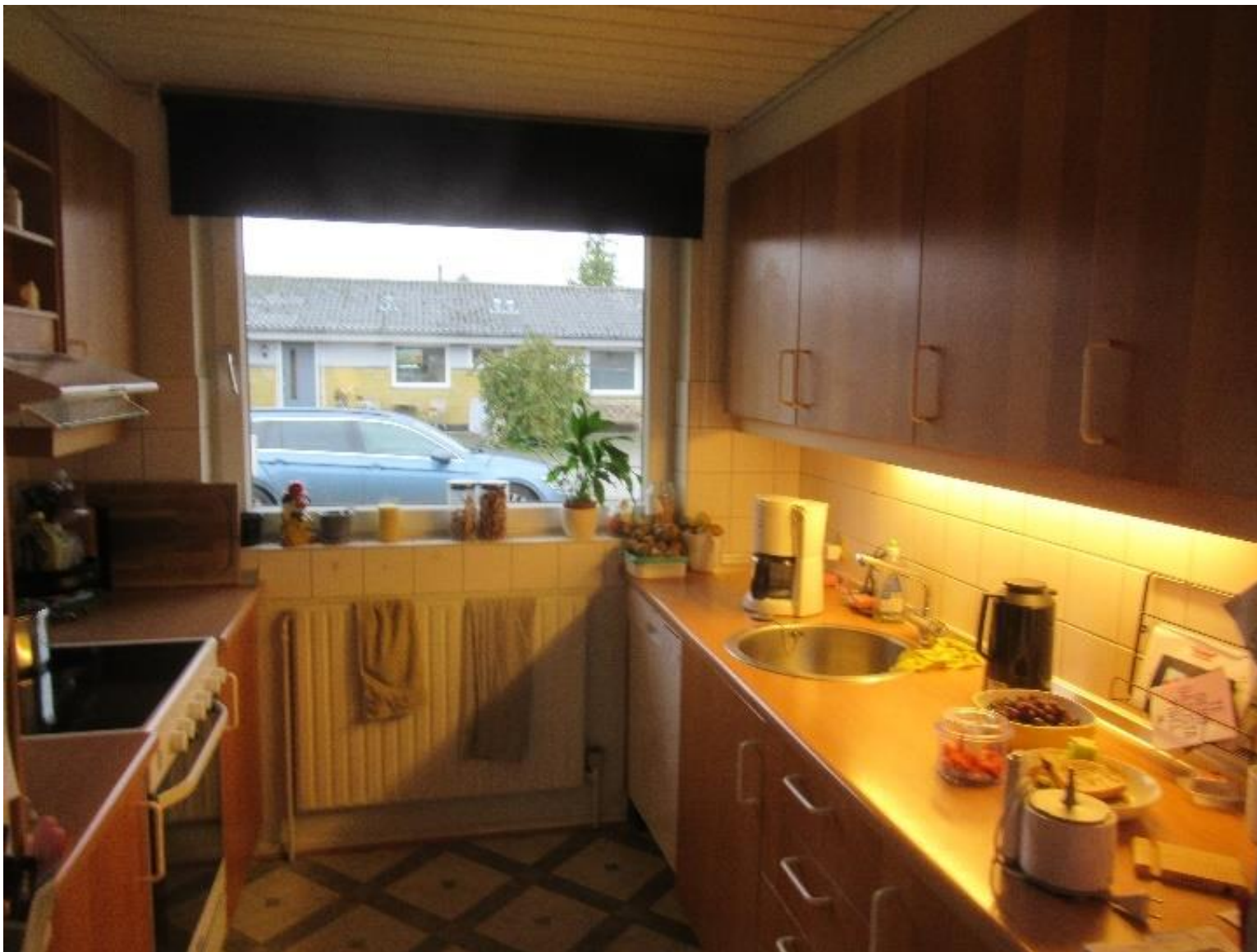
Eksempel på tidligere udskiftet køkken.