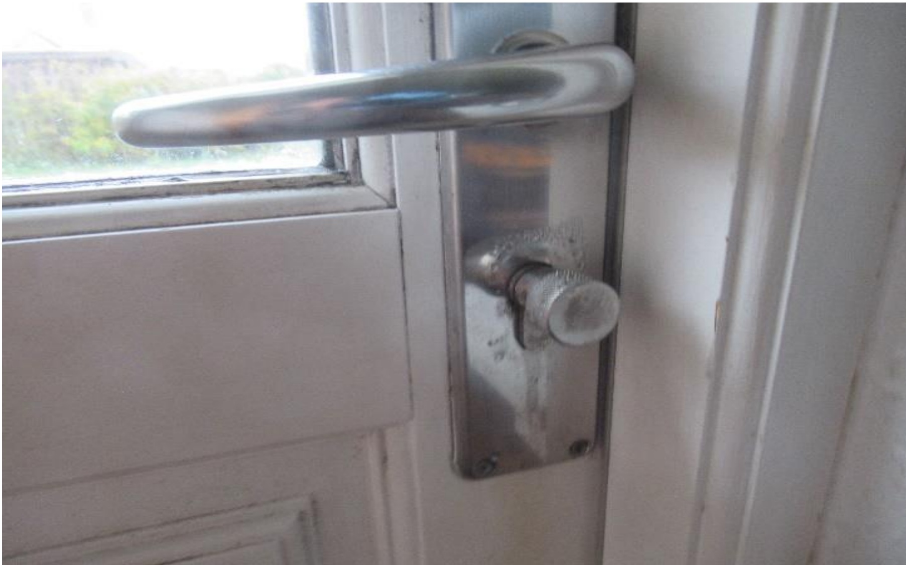
Eksempel på kondensdannelse på låsekasse